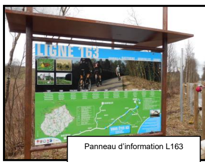
Panneau d'information L163