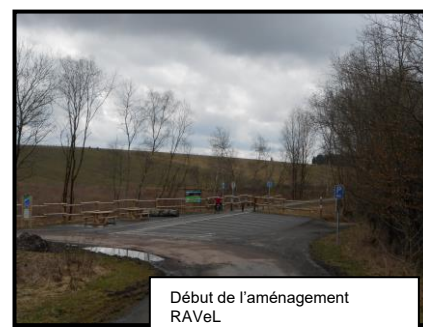
Début de l'aménagement RAVeL