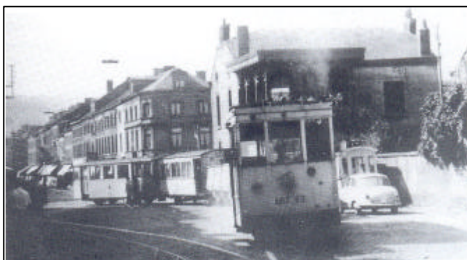
Le vicinal aux « Quatre Coins » en 1950. Extrait de « Andenne au détour des rues et des chemins », André Elen. Collection Office du Tourisme.

Parcours ( G = gauche, D = Droite) – Caractères droits : indications du trajet – Italique : informations historiques ou touristiques – Gras : variante possible.