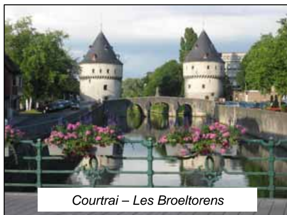
Courtrai – Les Broeltorens

55 km. Vélo (et plutôt VTC vu certains passages au sol un peu irrégulier sur les anciennes lignes de chemin de fer). Les kilomètres indiqués sont basés sur une mesure effectuée sur la carte topographique IGN au 1 : 50.000, version numérique (Lannoo Uitgeverij). Ils sont donnés à titre indicatif. De légères différences peuvent se présenter d'un compteur vélo à l'autre.