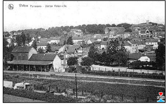
Gare de Virton