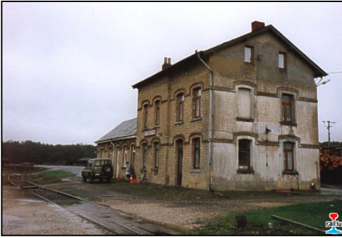
Ancienne gare de Croix-Rouge