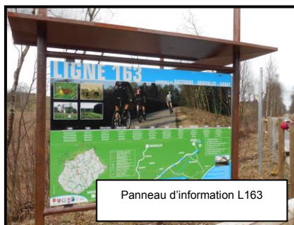
Panneau d'information L163