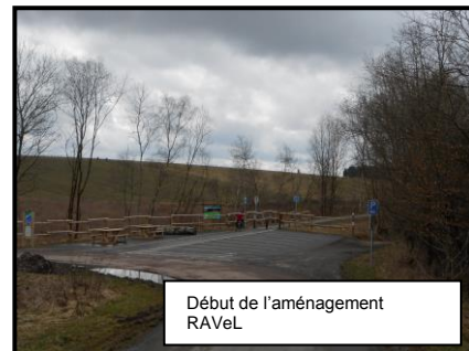
Début de l'aménagement RAVeL